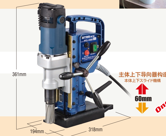
主体上下导向器构造 本体上下スライド機構